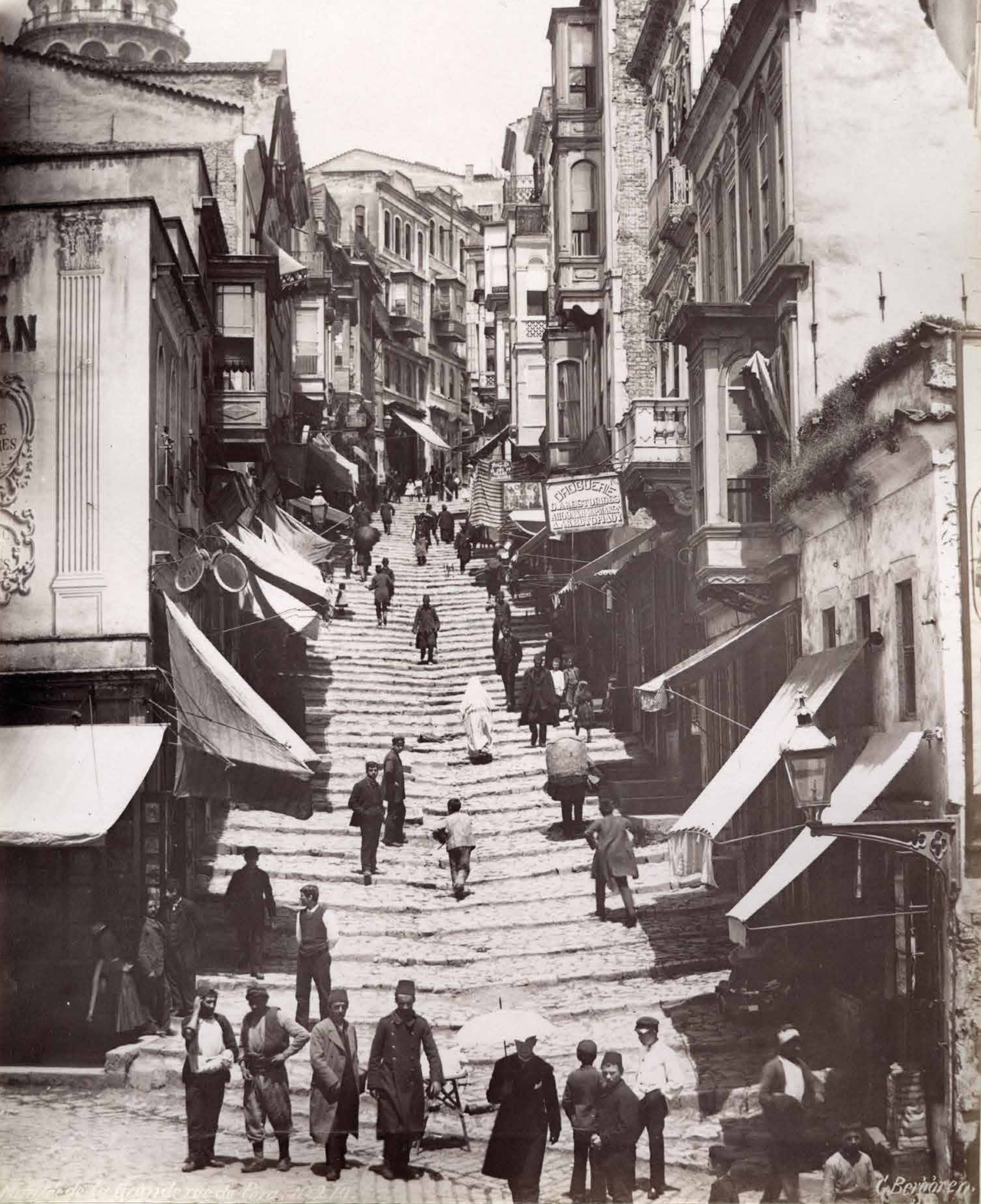
La grande rue de Pera.