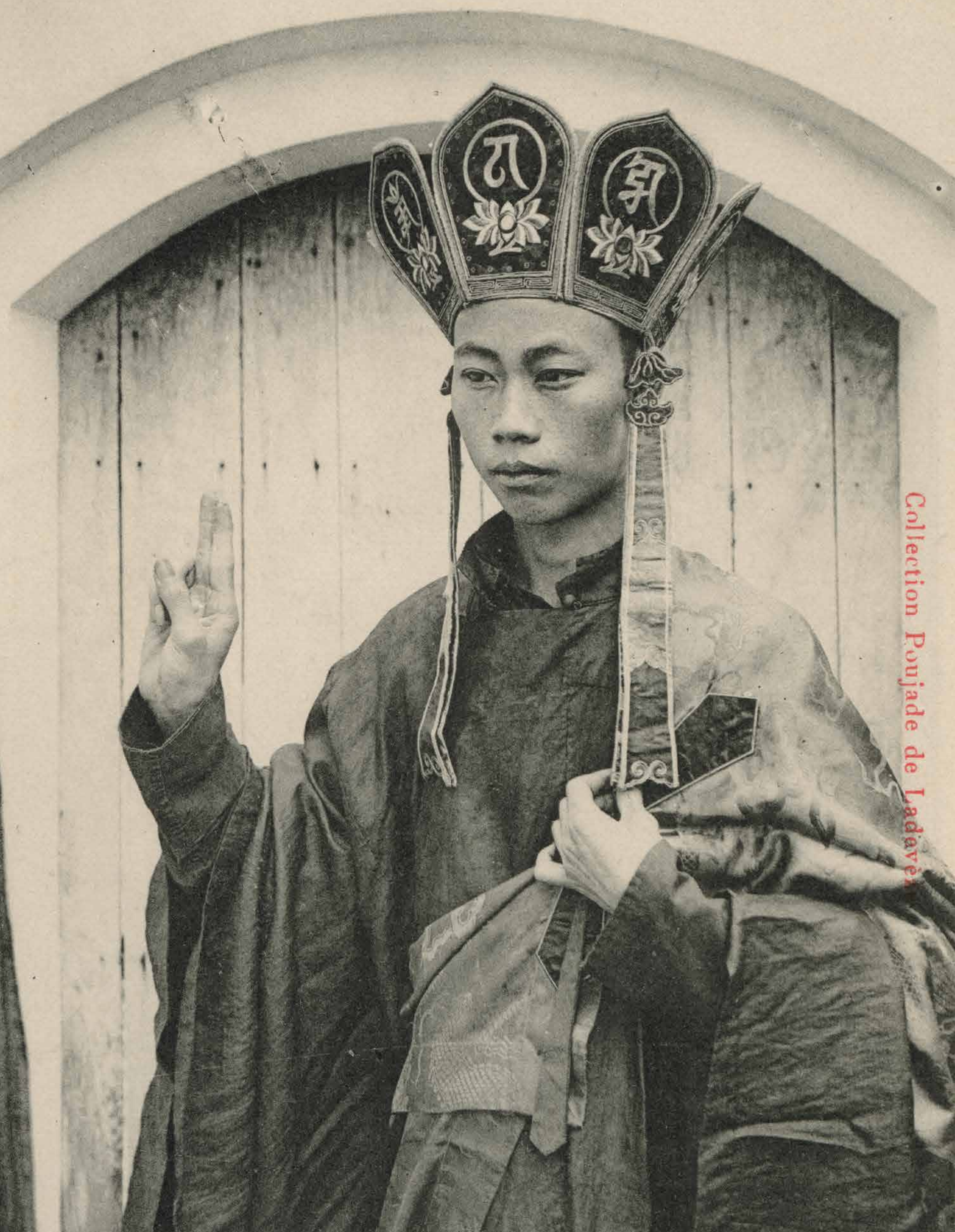
Ho Chi Minh 1900-tal Folke Cronholm

Buddhistisk präst i Ho Chi Minh-staden (Saigon), Vietnam, tidigt 1900-tal.